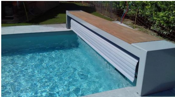
Le volet se déplace manuellement pour maintenir l'espace baignade aéré

Un volet automatique permet d'assurer une piscine plus propre, plus sûre et mieux tempérée. Il s'agit donc d'un équipement aux fonctionnalités importantes lorsque le bassin est fermé.