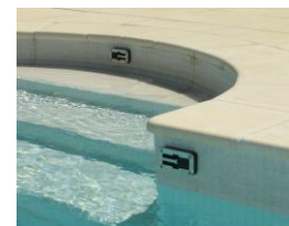
Ancrages de sécurité

Conforme à la norme NF P 90-308, ce volet répond aux exigences de la loi sur la sécurité des piscines. Lorsque le bassin est fermé, il est important de verrouiller le tablier à l'aide d'accroches de sécurité disposées sur chaque largeur du bassin.