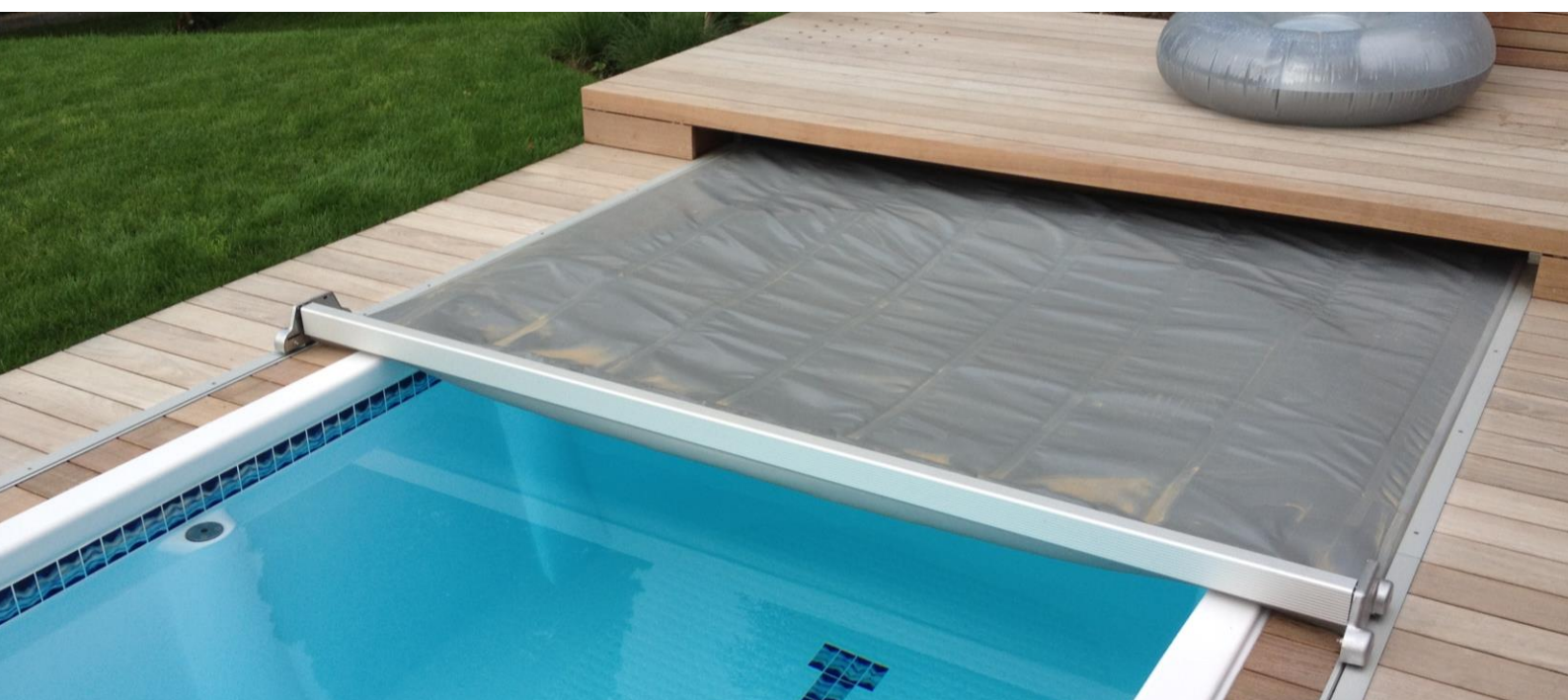
Couverture automatique pour SPA

T&A propose une couverture intégrée lors de la construction, ou hors sol pour spa déjà installé. Le système se manipule très facilement par l'actionnement d'une clé. Il faut environ 15 secondes pour ouvrir ou fermer votre espace bien-être.